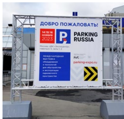
Рекламная конструкция, входная группа, 3x2м

Наклейка на пол в выставочном зале, цена за 1 кв.м. .... 8 800 р.