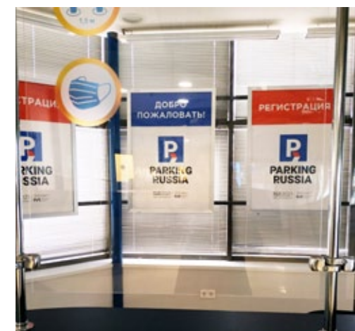
Лайтбокс в зоне регистрации 0,84x1,19м или 1,19x0,84м