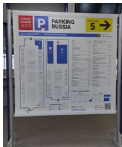
Конструкция с планом павильона