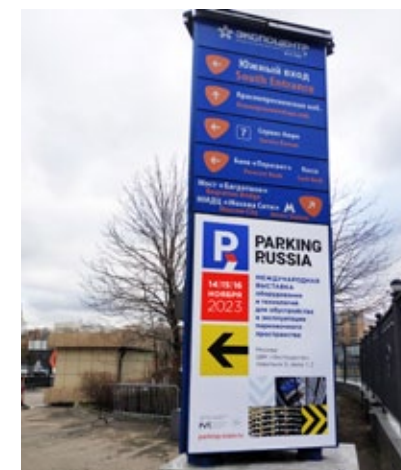
Рекламная конструкция, стела, 2x3м